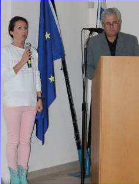
Coordonatoarea din Grecia împreună cu directorul instituției gazdă