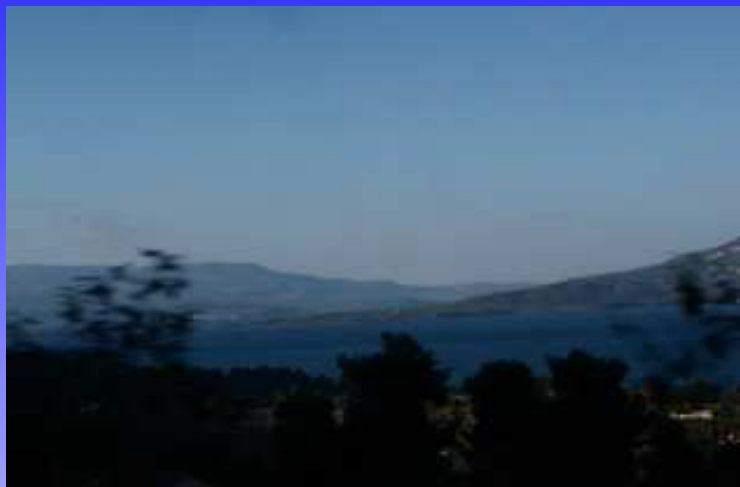
Peisaj imortalizat în drum spre Trikala