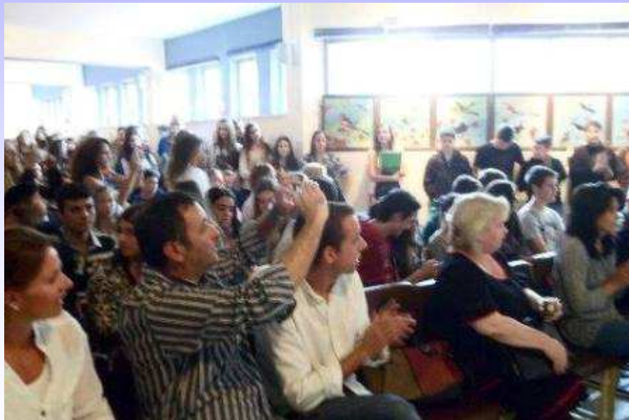
Spectacolul oferit de gazde : muzică și dansuri tradiționale