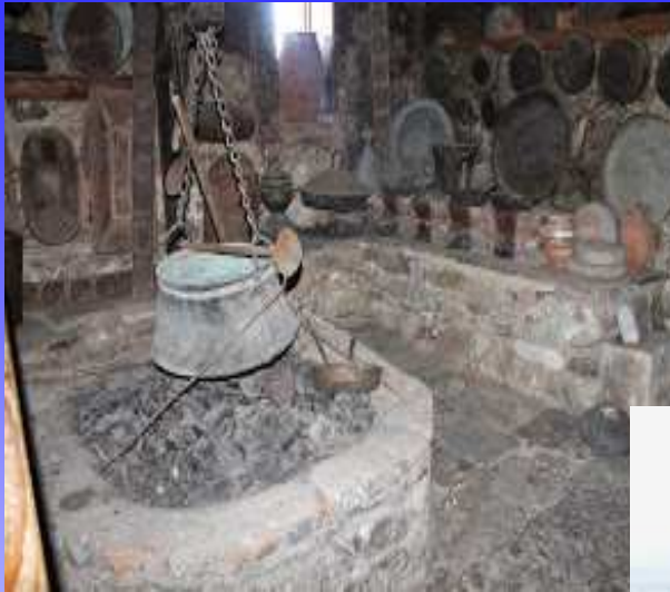
Imagini din Meteora